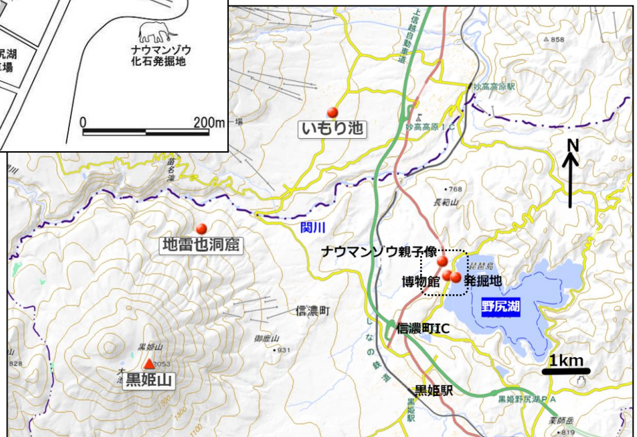
【野尻湖周辺マップ】