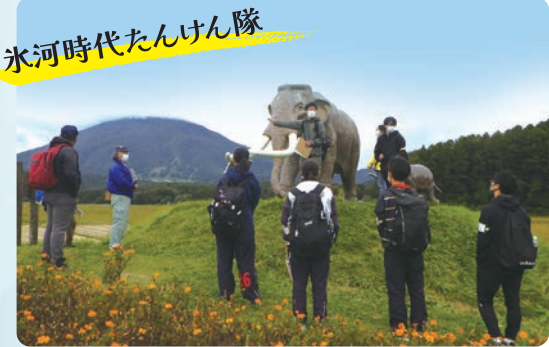
氷河時代たんけん隊