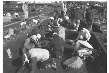
第20次発掘のようす